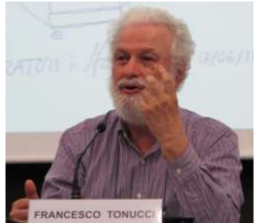
Conferència "El paper de la comunitat en l'educació dels infants". Museu de Ciències Naturals de Barcelona. 2012

L'objectiu del projecte de la ciutats dels infants i els seus consells era tractar d'aconseguir que l'Administració baixés els seus ulls fins a l'altura d'un nen, per no perdre de vista a ningú. Una ciutat adequada als nens és una ciutat adequada per a tots i va caldre demostrar que el infants eren absolutament capaços d'interpretar i d'expressar les seves pròpies necessitats i contribuir al canvi de la seva ciutat, donat que les seves necessitats coincideixen amb les de la major part dels ciutadans, sobretot amb les dels més febles. Per aconseguir aquest grau de participació va caldre posar l'èmfasi en el protagonisme infantil i en el seu dret a participar en les decisions que els afecten sense ser utilitzat pels adults com a cobertura de les seves responsabilitats.